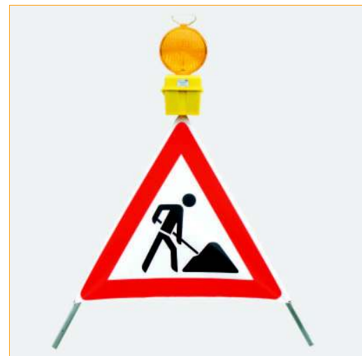
Znak drogowy składany z lampą Primär 823/2