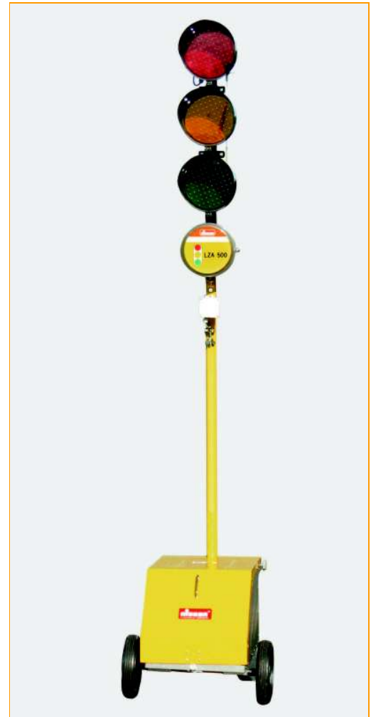
Sygnalizacja Tymczasowa LZA 500-LED