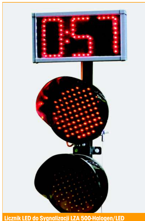
Licznik LED do Sygnalizacji LZA 500-Halogen/LED