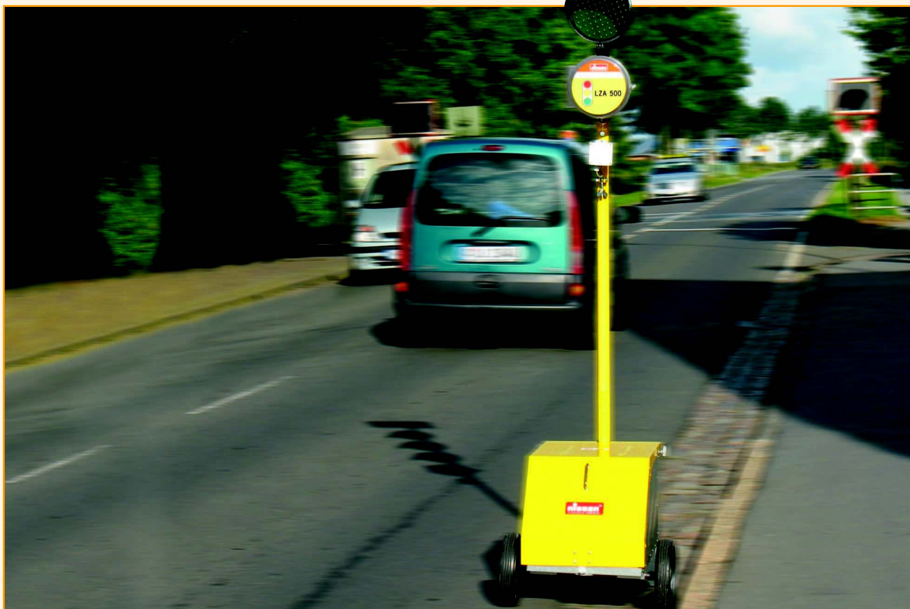
Sygnalizacja tymczasowa obsługująca ruch wahadłowy i skrzyżowania