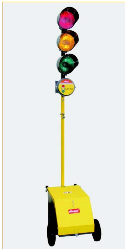
Sygnalizacja Tymczasowa LZA 500-Halogen