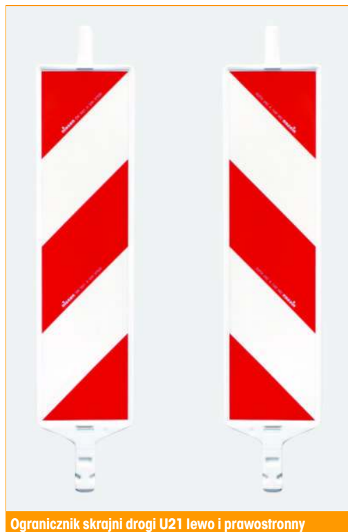
Ogranicznik skrajni drogi U21 lewo i prawostronny

60 skrajni na palecie - dostępne również w innych ilościach