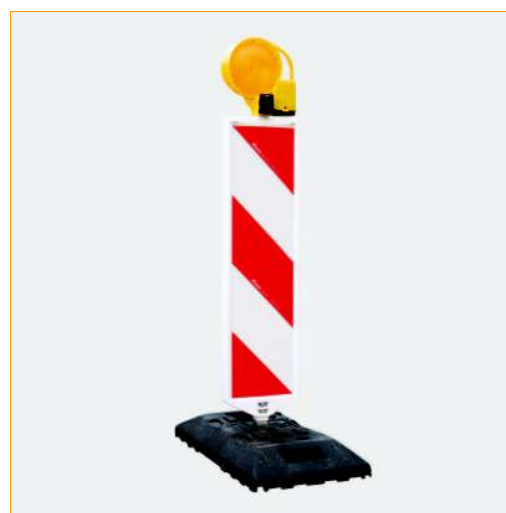
System ogranicznika skrajni drogi