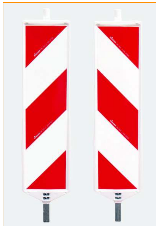
Ogranicznik skrajni drogi U21 lewo i prawostronny

60 skrajni na palecie / 30 podstaw na palecie - dostępne również w innych ilościach