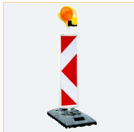
System ogranicznika skrajni drogi WeBaNi 40